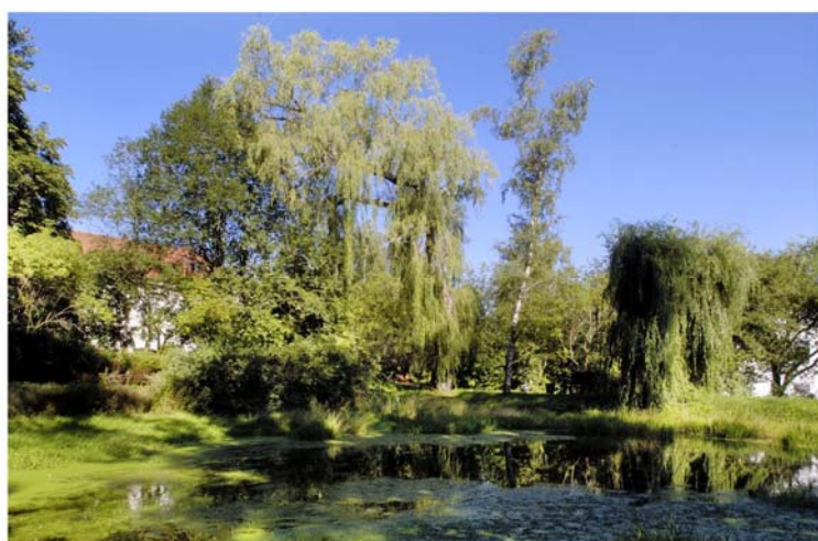
Ansicht des Patientenparks