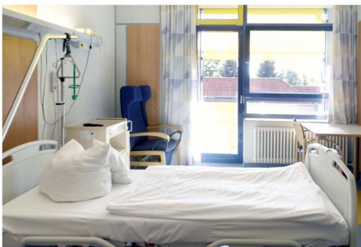
Ansicht eines Patientenzimmers

Mutter und Kind haben die Möglichkeit in der Klinik für Frauenheilkunde und Geburtshilfe im rooming-in-System betreut zu werden