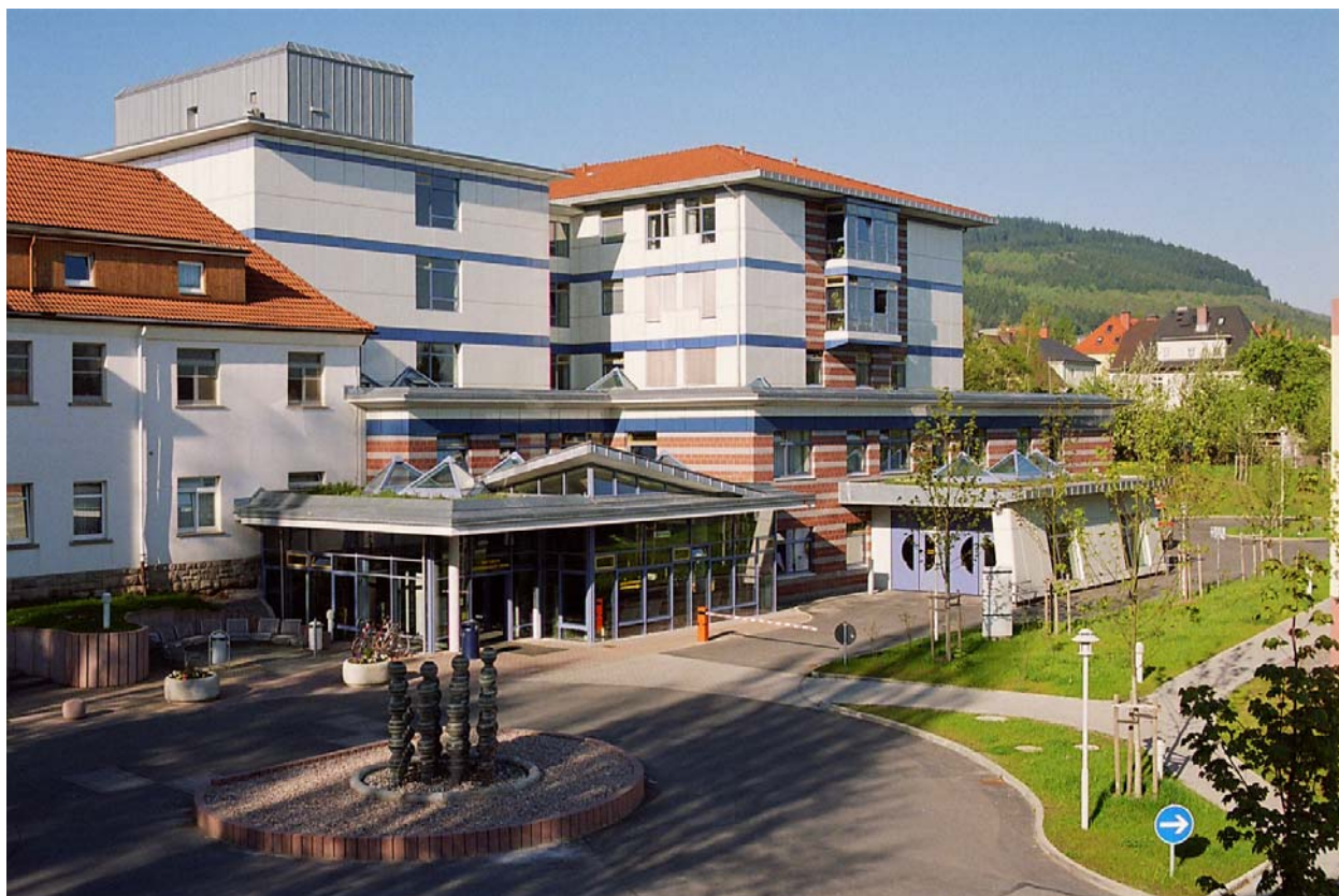
Ansicht des Haupteingangs der IIm-Kreis-Kliniken am Standort Ilmenau

Die IIm-Kreis-Kliniken Arnstadt-Ilmenau gGmbH sind ein Krankenhaus der Regionalversorgung, welches als modernes Gesundheitszentrum die wohnortnahe medizinische Versorgung an zwei zentralen Standorten, Arnstadt und Ilmenau, mit allen notwendigen medizinischen Einrichtungen für Diagnostik und Therapie sicherstellt. Die Klinik für Suchtmedizin in Großbreitenbach ergänzt das stationäre Behandlungsangebot über die Kreisgrenzen hinaus.