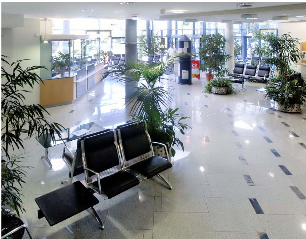
Ansicht des Empfangs